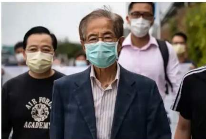
Pro-democracy activist Martin Lee issues the Centre District police station in Hong Kong on Saturday after his arrest earlier in the day.

“The Xi regime is taking aim at democracy in Hong Kong, using covid-19 as a cover” .